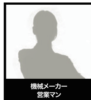
機械メーカー 営業マン